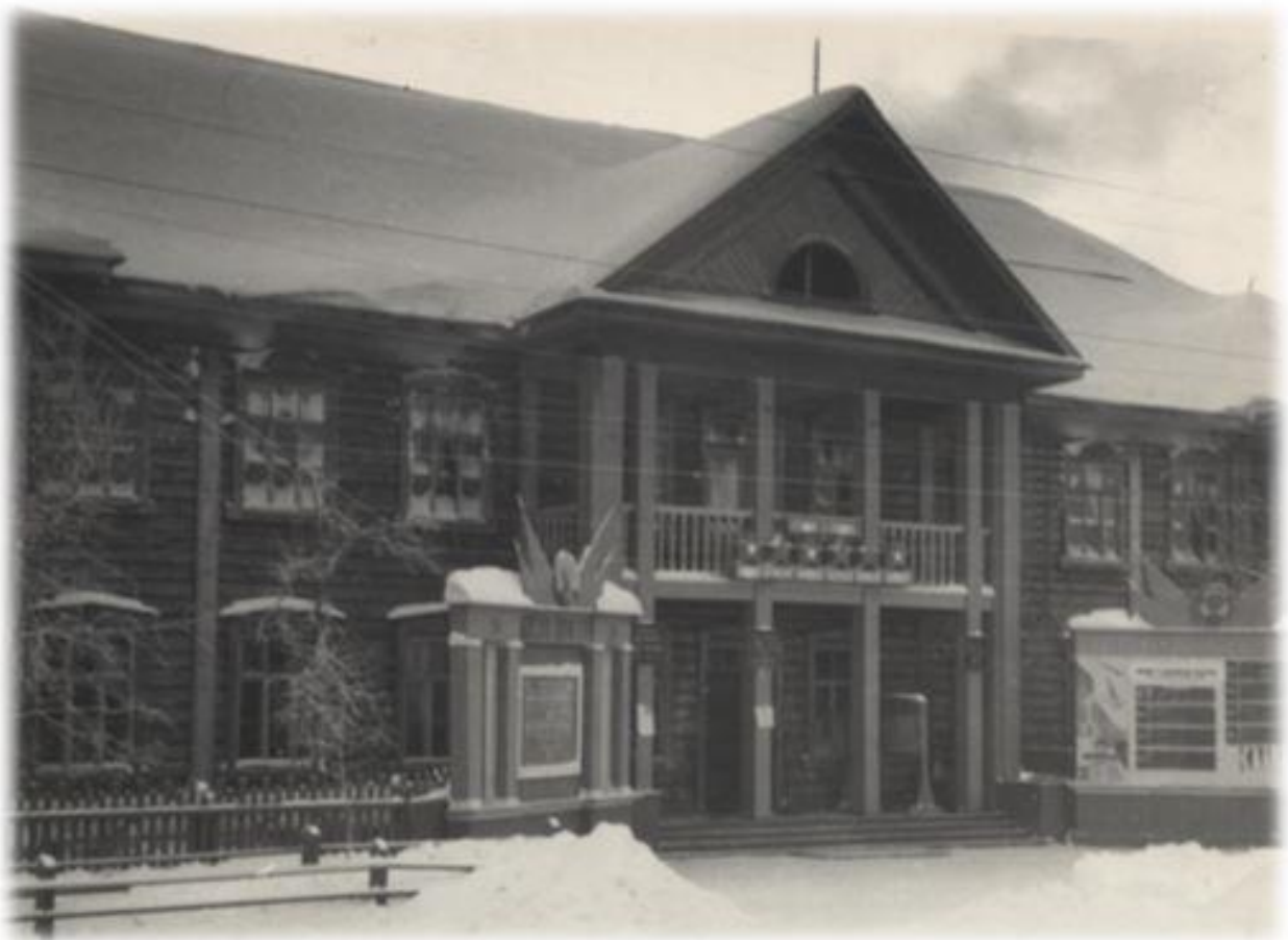
На фото: здание Богучанлес, 1980-е годы

«Я работала в "Богучанлесе", в то время в Красном уголке предприятия довольно часто выступали интересные люди, которых приглашал Богучанский РК КПСС. И где-то в 1980-х годах на такой встрече с коллективом был и Б.Б.Бобровский. И запомнились его теплые слова в адрес земляков. Он вспоминал, как красноярское книжное издательство отказалось печатать его книгу. Поехав в Москву, был приятно поражен, что его роман "Взорванное время" был напечатан, а самого автора приняли в Союз писателей. Оценили тот факт, что Бронислав Бобровский писал о простых солдатах».