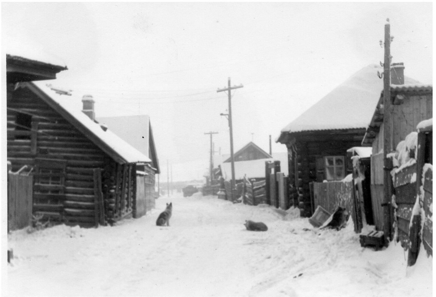
Богучаны, начало 1960-х, переулок Гоголя