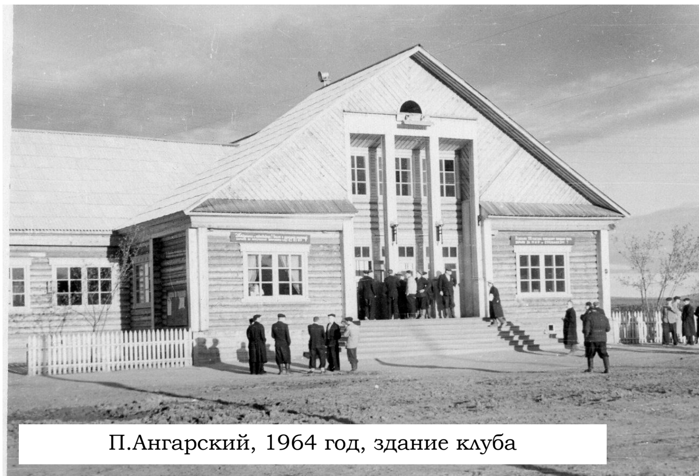
П.Ангарский, 1964 год, здание клуба