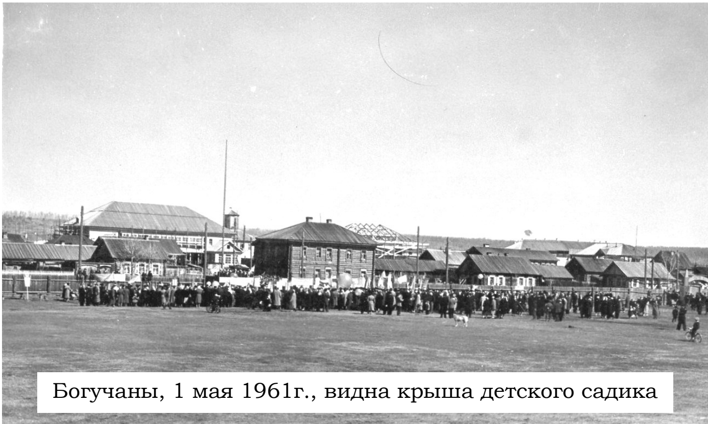
Богучаны, 1 мая 1961г., видна крыша детского садика