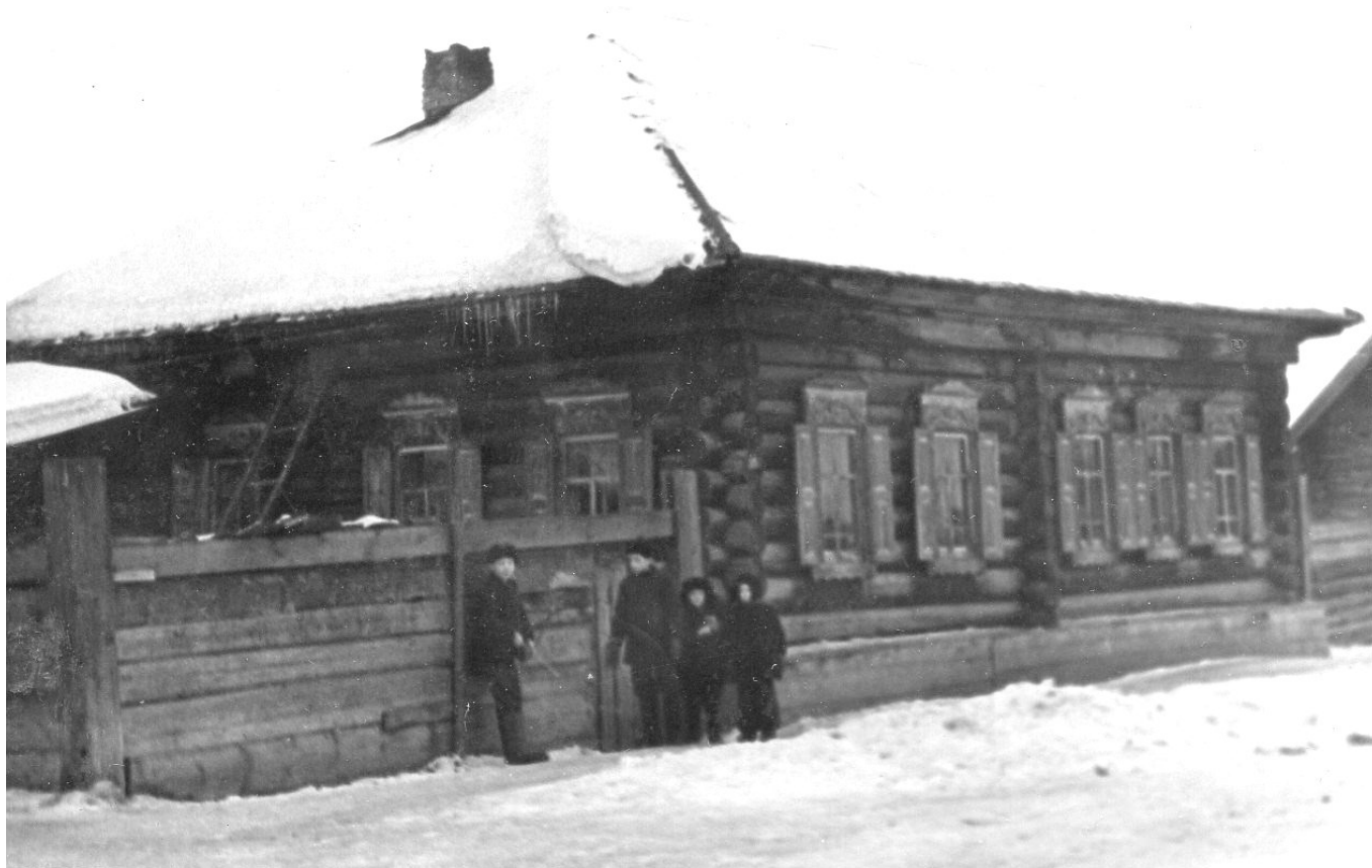
Богучаны, 1963 год, ул.Октябрьская, 38. Подпись на фото: «Наш дом»