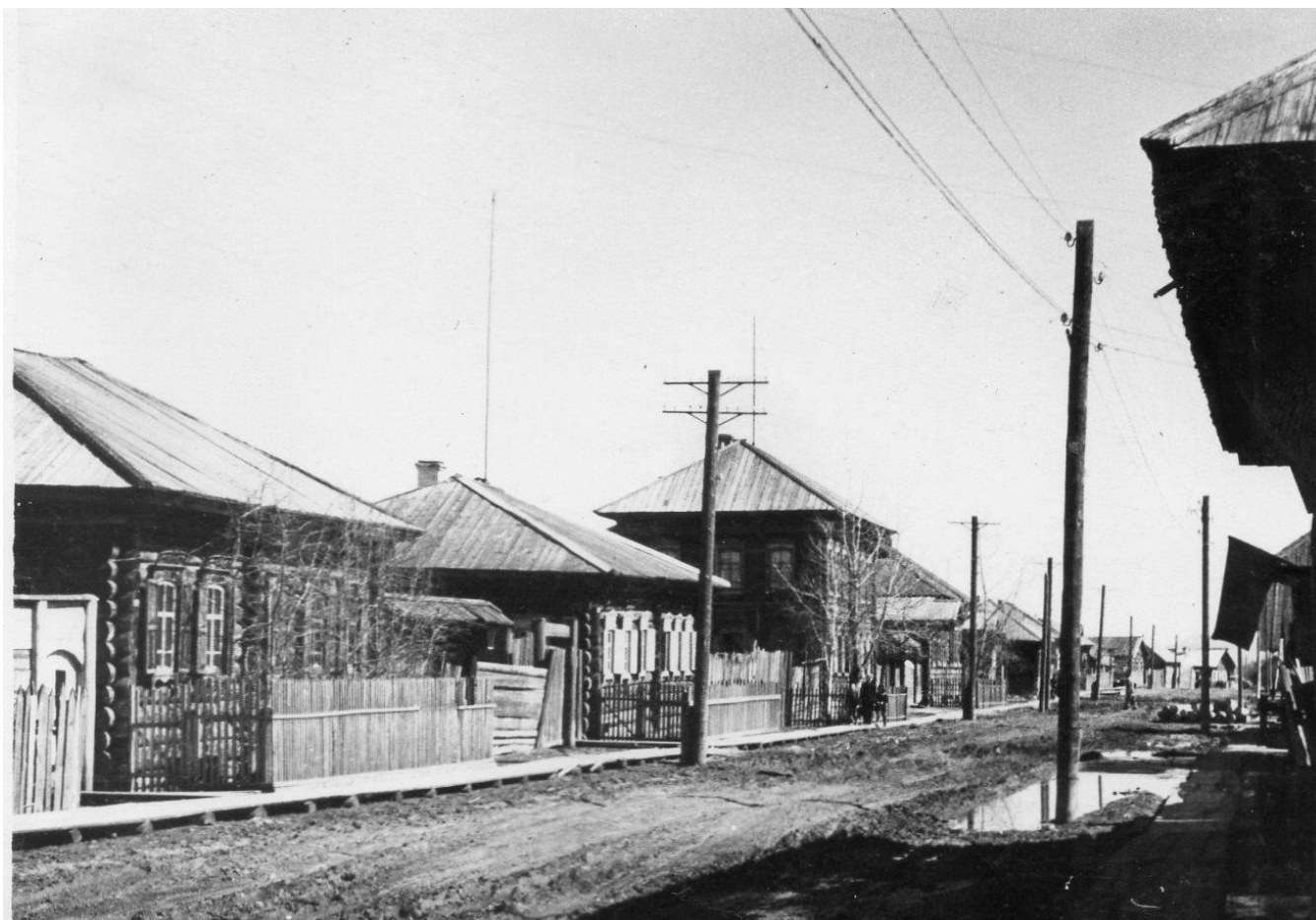
Богучаны, 1962 год, ул.Октябрьская, вид в сторону старой почты