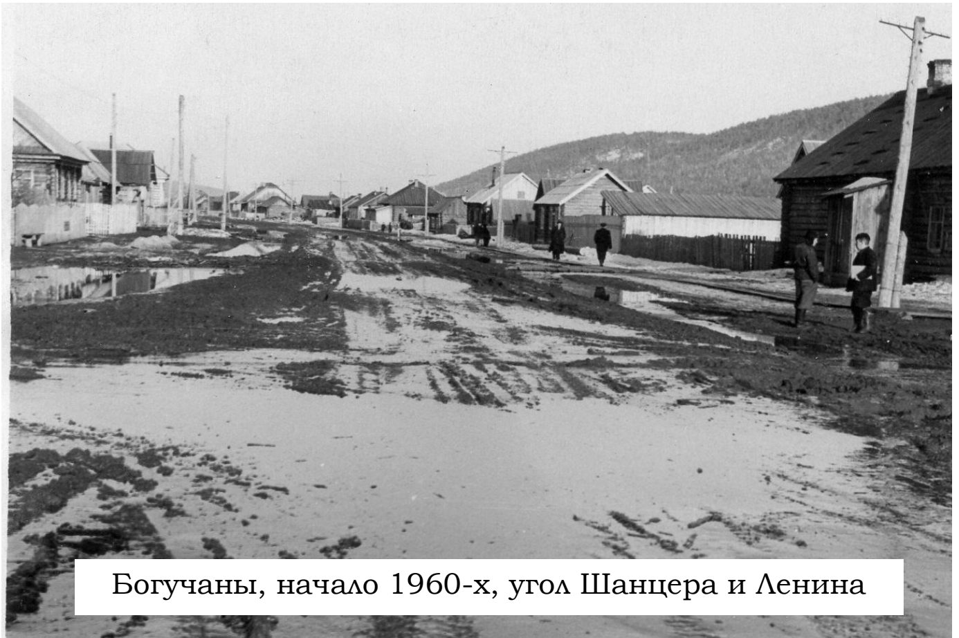
Богучаны, начало 1960-х, угол Шанцера и Ленина