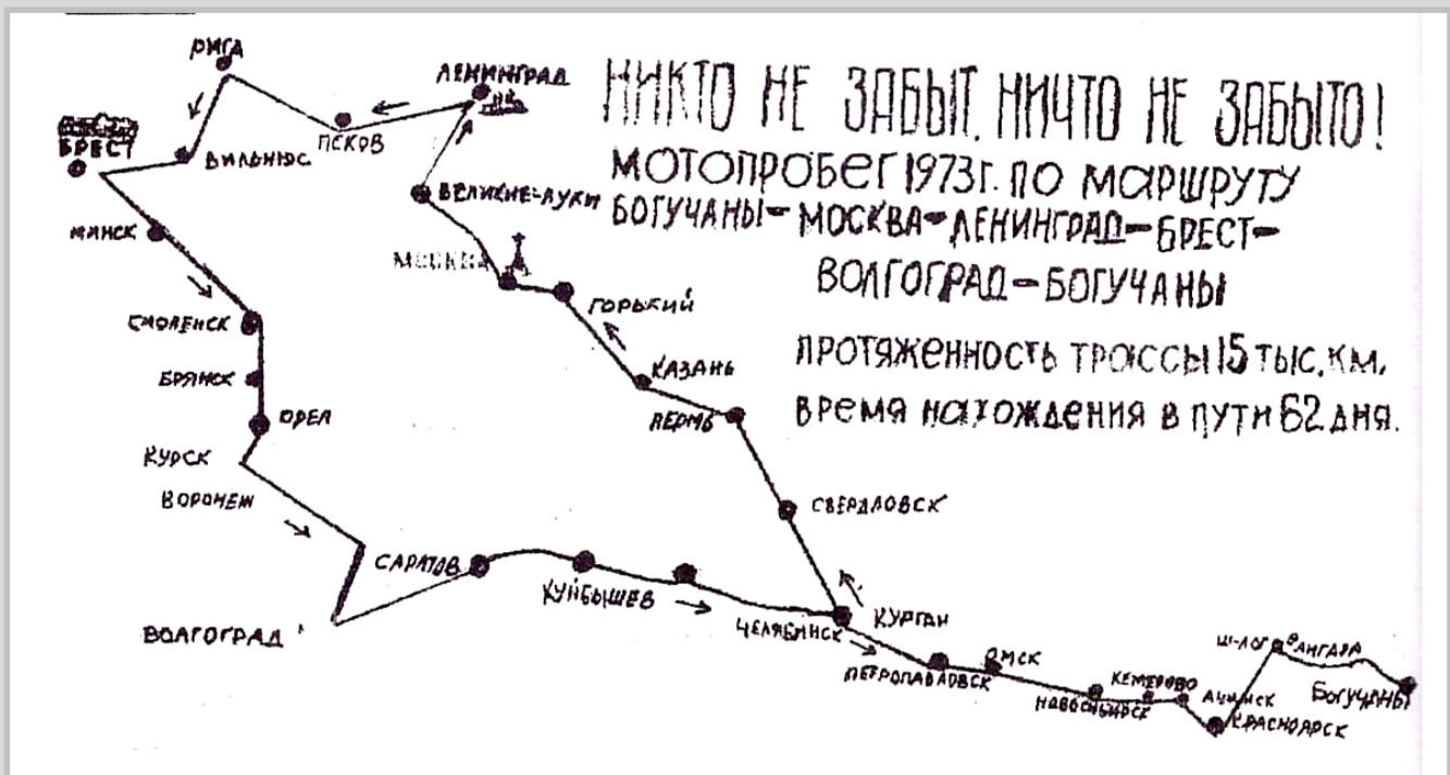
Карта мотопробега 1973г. «Богучаны - Брест - Богучаны»

Создал документальную киноленту «Дорогами славы отцов» по материалам мотопробега по маршруту Богучаны—Брест—Богучаны (1973г.). Кроме этих двух фильмов в семье хранится много киноматериала о жизни нашего района.