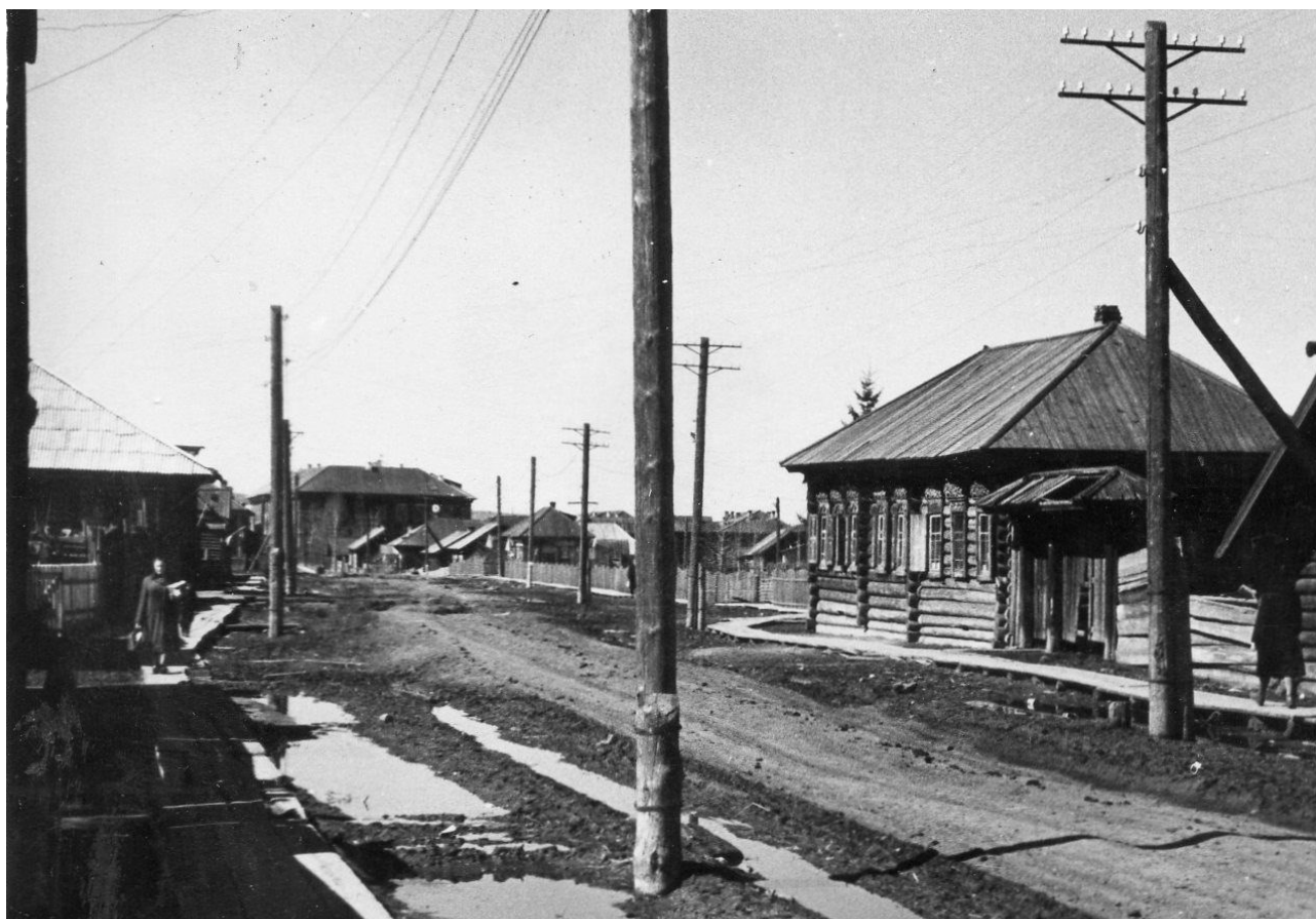
Богучаны, 1962 год, ул.Октябрьская, вид от редакции в сторону школы