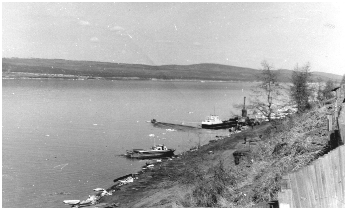
1964 год, Ангара после ледохода