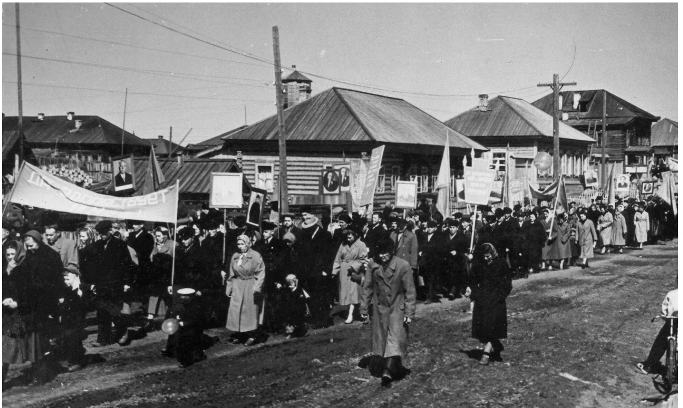
Богучаны, 1961 год, первомайская демонстрация