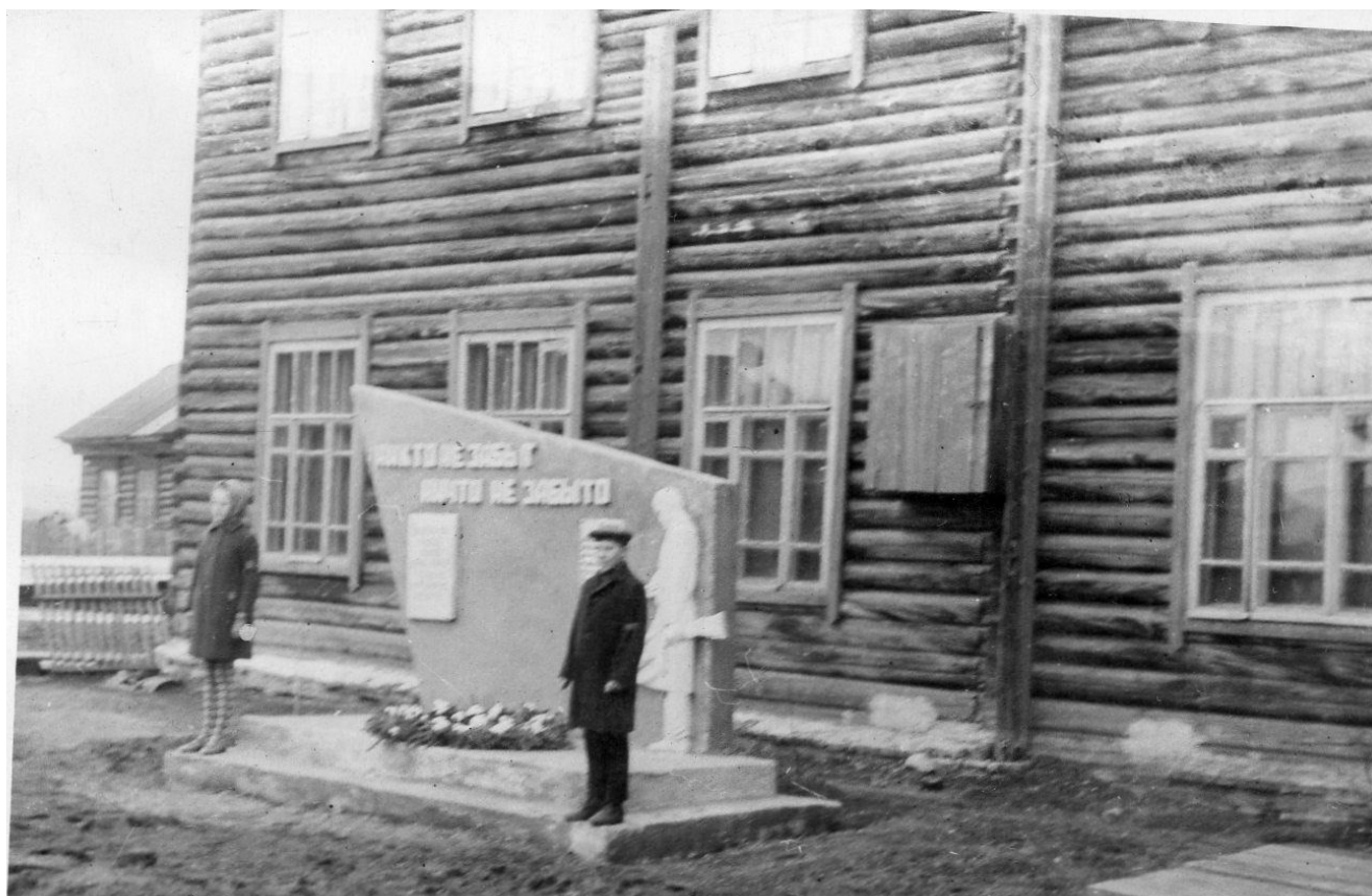
Почетный караул у БСШ № 1, конец 1960-х