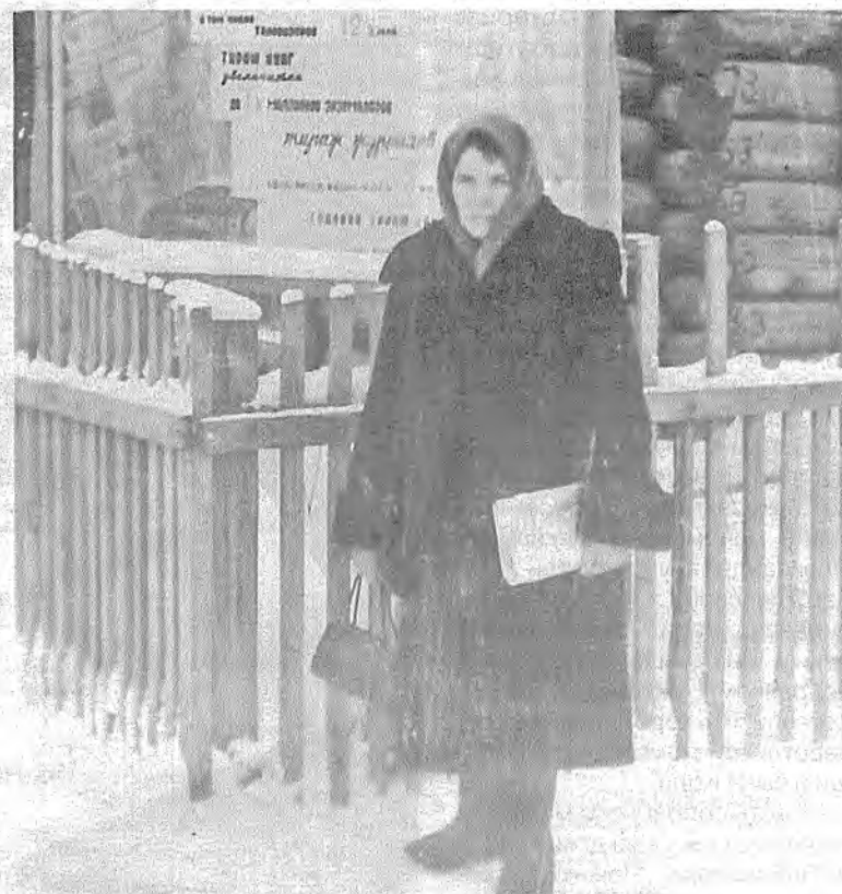
Около библиотеки на углу улицы Октябрьская, 1961 г.