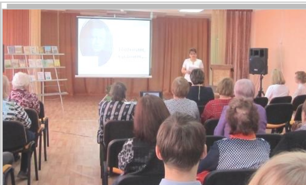
Шильковские чтения, 2016г., Богучаны