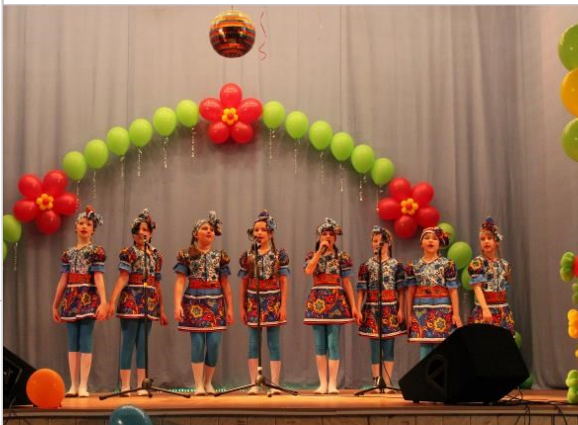
Выступления участников фестиваля