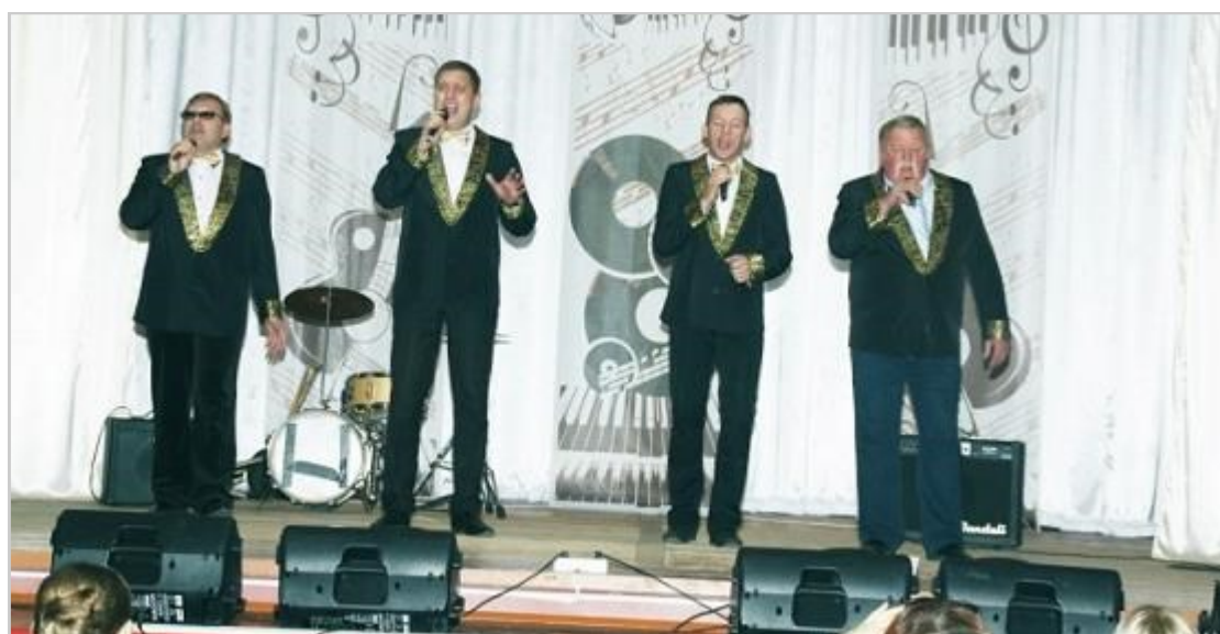
Выступление коллектива «Поющее мужское братство»