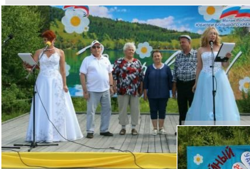
На фото: награждение семей - юбиляров