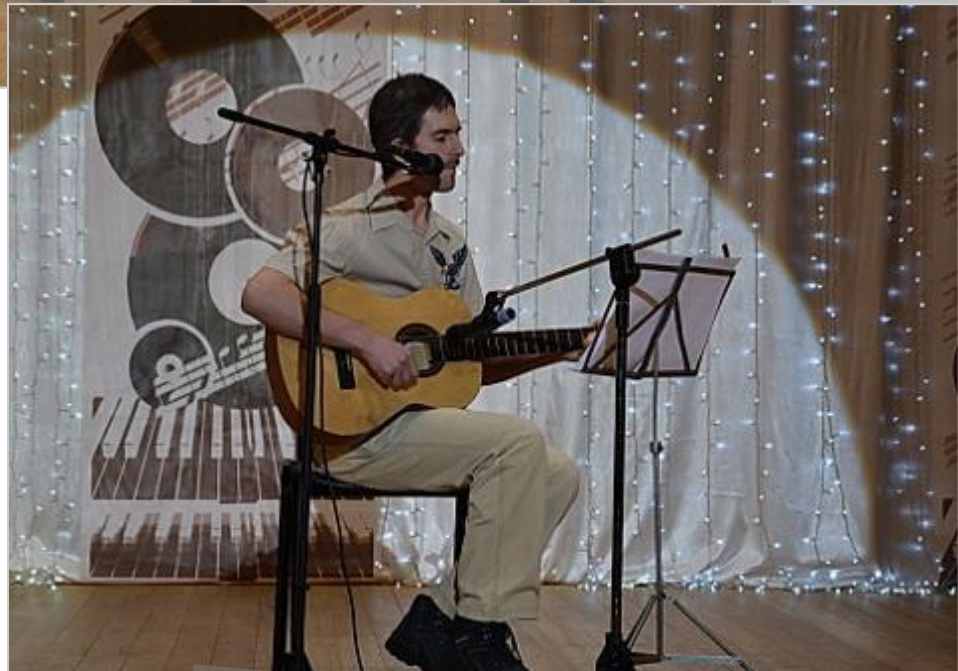
Участники фестиваля, 2017г.