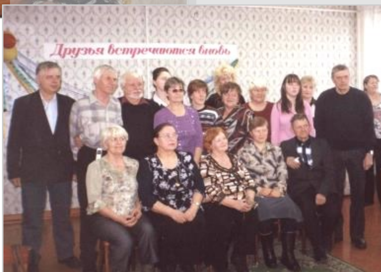
участники слета-встречи самодельных авторов, 2007г.