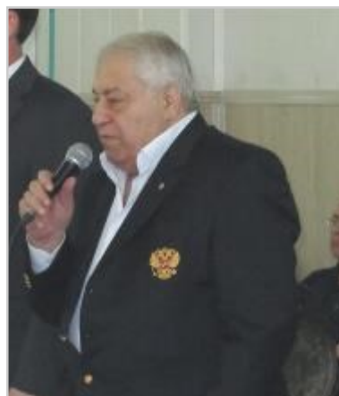
Выступает почетный гость сорев- нований Д.Миндиашвили, 2011г.