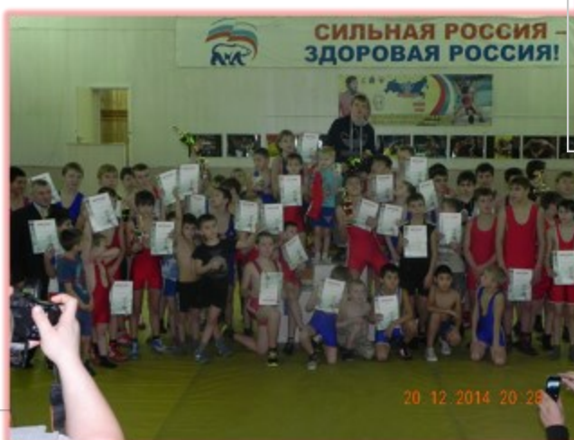
Участники соревнований 2014г.