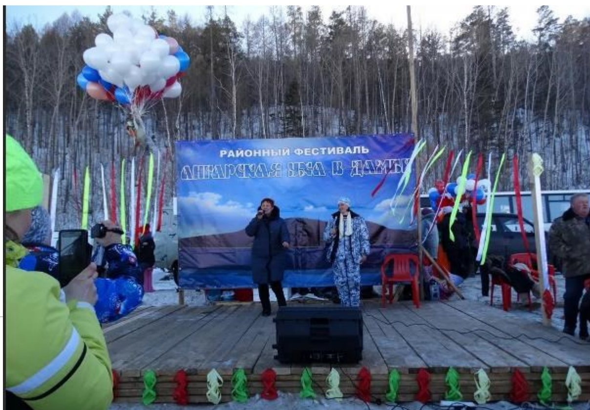
Торжественное открытие фестиваля