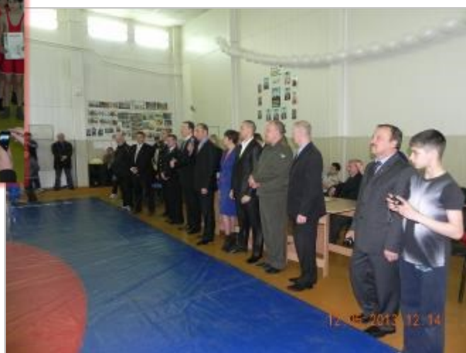
Торжественное открытие соревнований, 2013г.