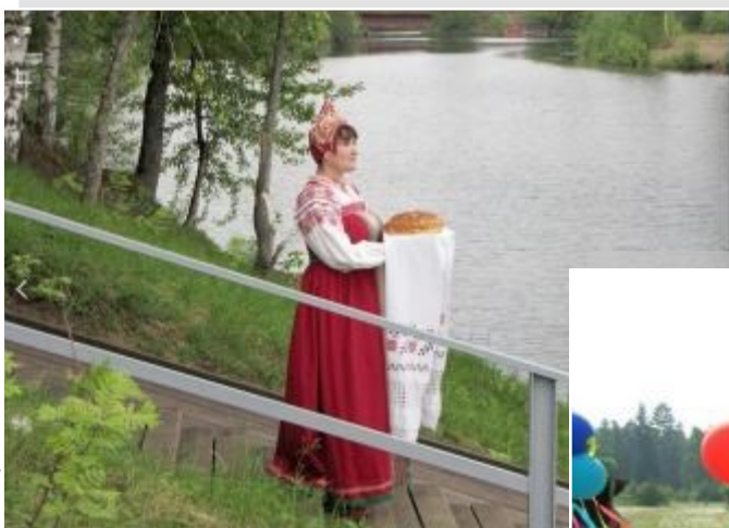
На фото: мероприятия фестиваля

По традиции на празднике чествуются лучшие семьи Богучанского района.