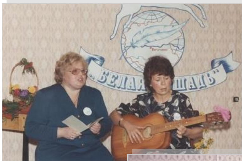
участники слета-встречи самодельных авторов, 2000г.