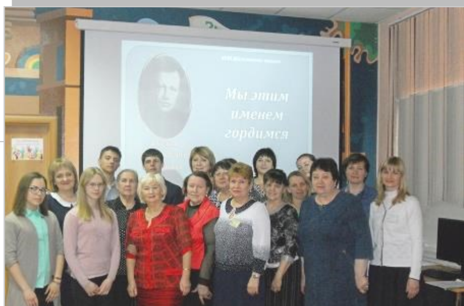
Шильковские чтения, 2018г., сельская библиотека п.Таёжный