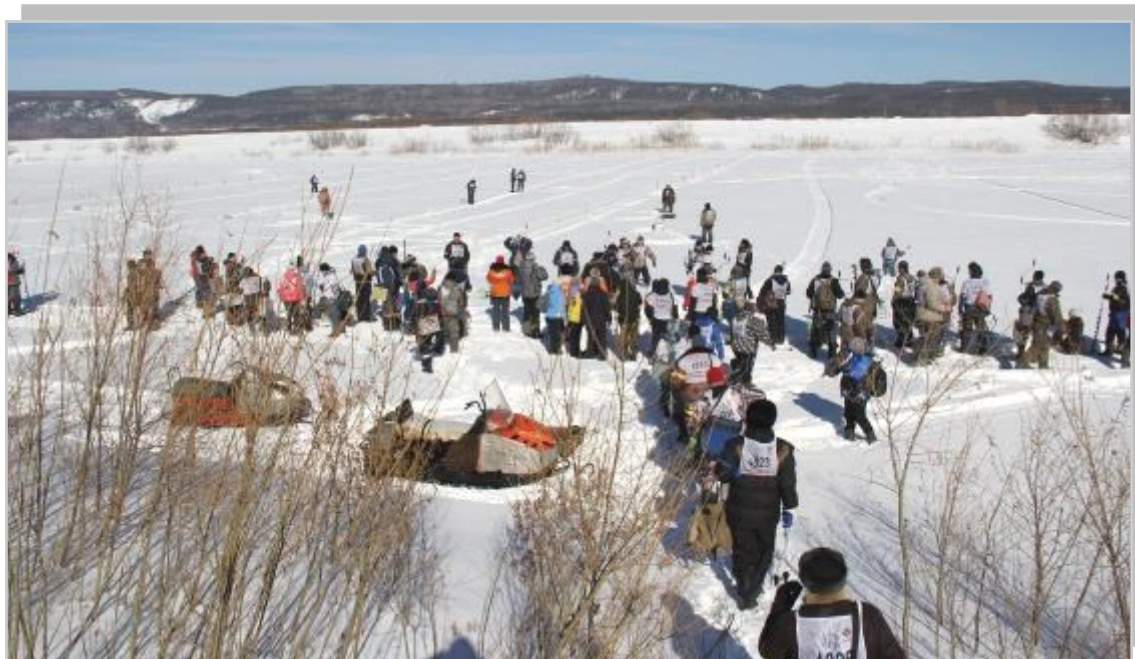
Участники занимают места на льду.

организовать на дамбе фестиваль – соревнование по подледному лову, который и объединил в себе вышеперечисленные качества: тут вам и общение, и любование красотой, и, конечно же, рыбалка! Первый фестиваль прошел в 2010 году и никто и подумать не мог, что он будет проходить с таким размахом.