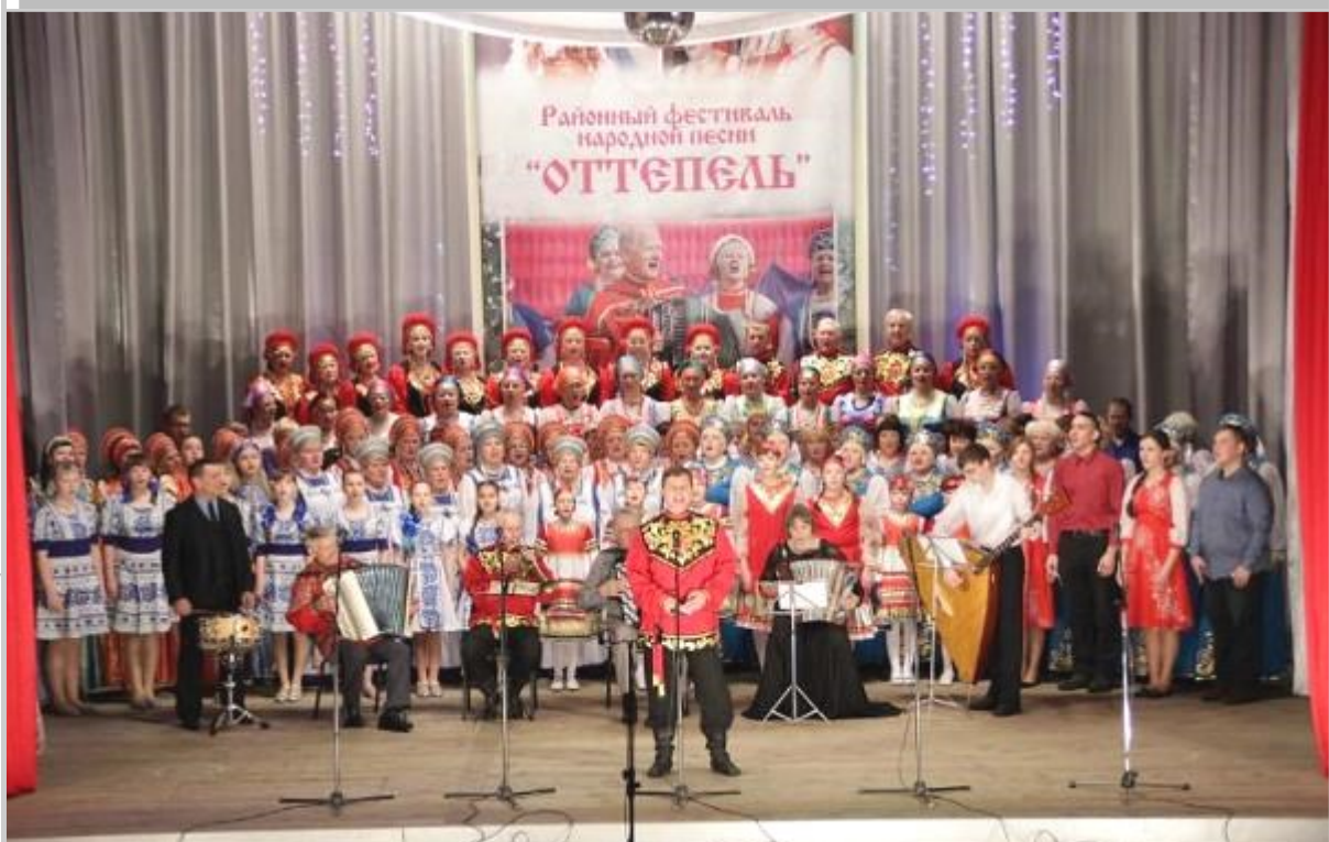
Выступление ансамбля «Русская песня»