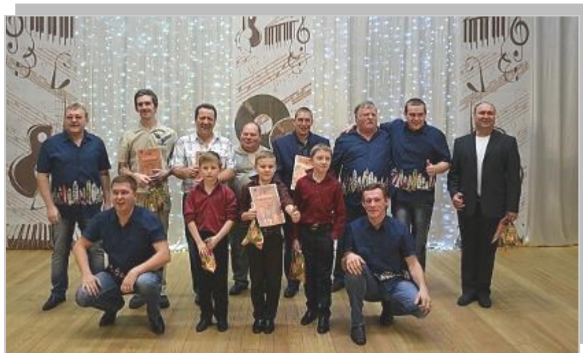
Участники фестиваля, 2017г.

На фестивале всегда царит замечательная атмосфера, душевная, располагающая обстановка. Участники не испытывают соперничества, а поют для себя, с неподдельным интересом смотрят и слушают, как выступают другие. Фестиваль «Поющее мужское братство» завоевал сердца земляков и с каждым годом приобретает всё большую популярность.