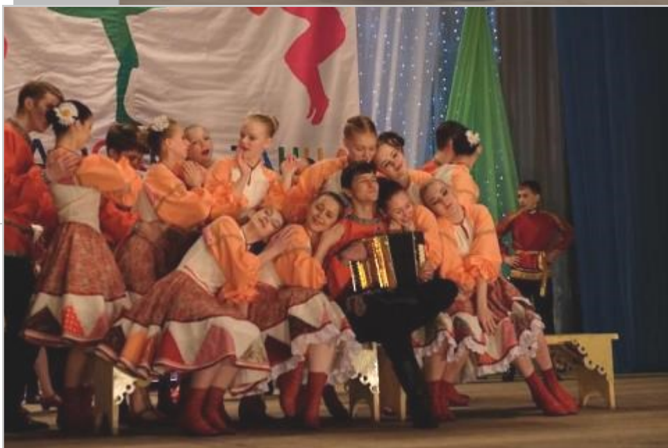
Выступление участников фестиваля