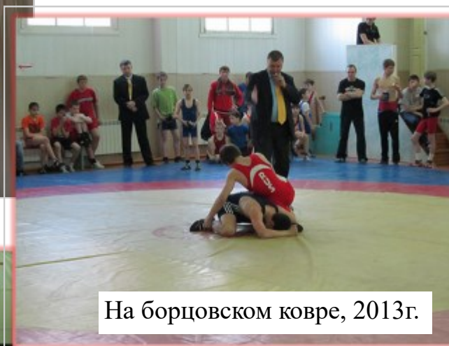
На борцовском ковре, 2013г.