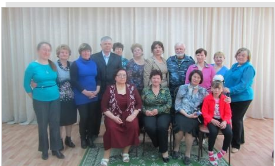
Участники слета-встречи самодеятельных авторов, 2014г.

Творчество самодеятельных авторов - это их состояние души, волнения сердца, веление времени. О чем бы они не писали - о природе, о любви, о родной земле - всё это проходит через их сердца к сердцам читателей.