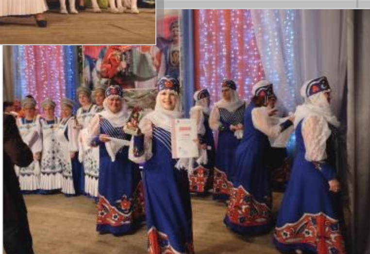
Награждение участников фестиваля