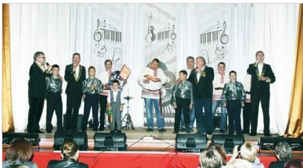
Выступление участников фестиваля