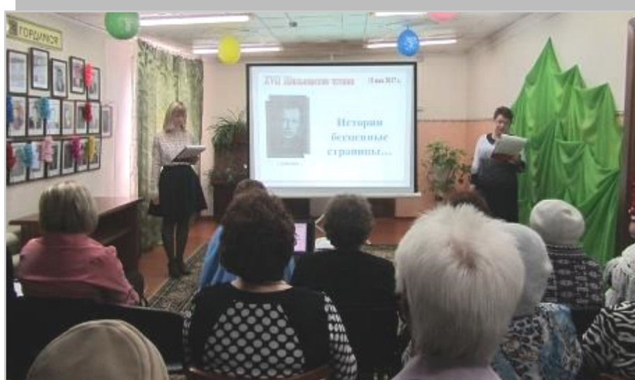
Шильковские чтения, 2017г., сельская библиотека п.Ангарский