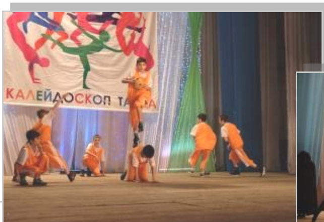
Выступление участников фестиваля «Калейдоскоп танца»

Самое главное для фестиваля то, что есть желающие танцевать и есть те, кто это желание поддерживает и реализует, а зрители всегда могут насладиться искусством танца, атмосферой творчества и взаимопонимания.