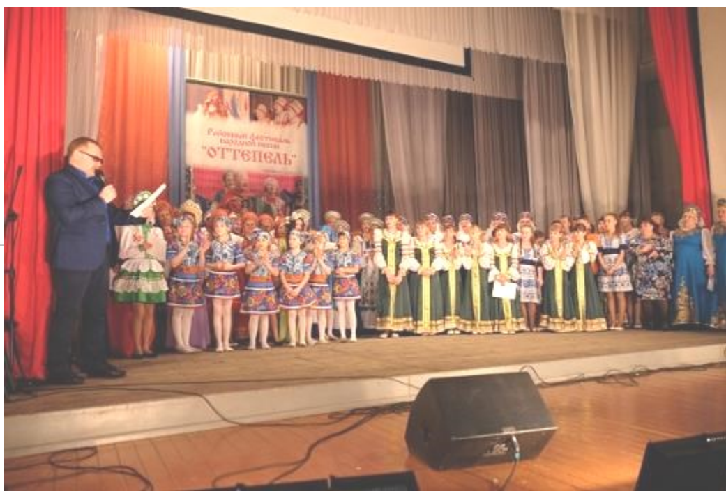
Участники фестиваля «Оттепель»