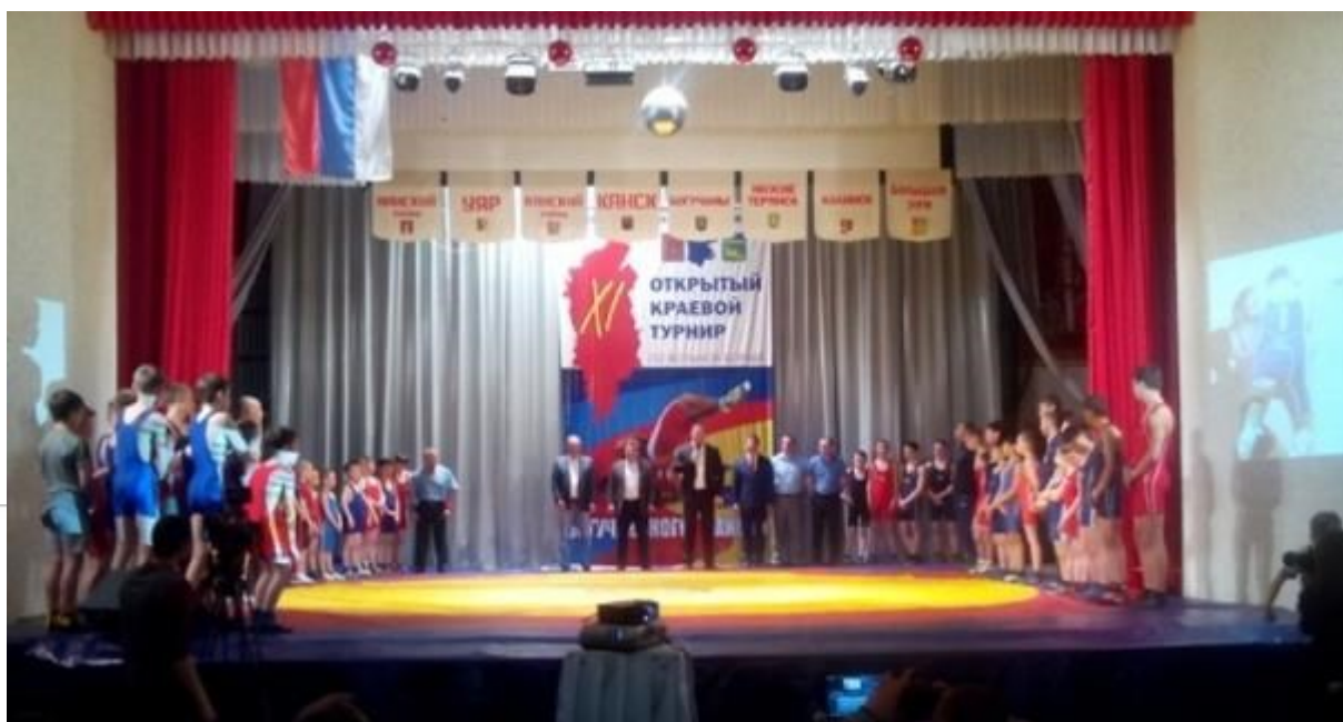
Торжественное открытие XI краевого турнира по вольной борьбе, 2016г