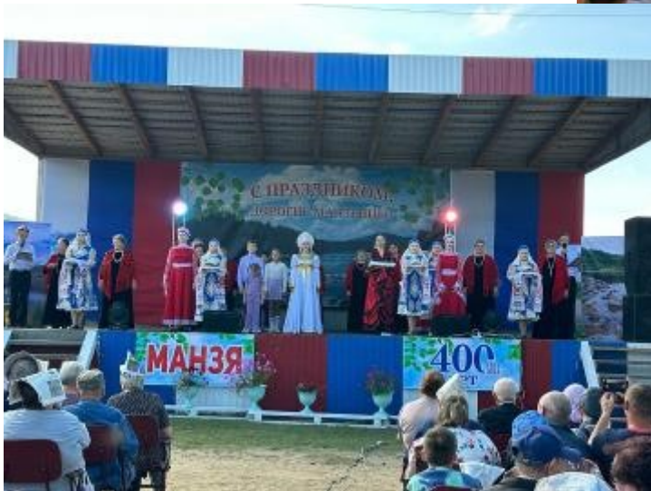
Август 2024, на юбилее поселка Манзя