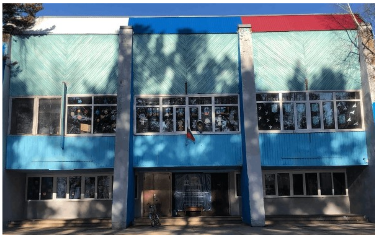
Дом культуры п.Гремучий