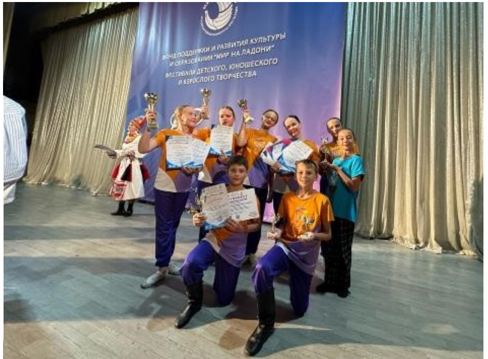
Август 2024, г.Сочи, Международный конкурс детского и юношеского творчества « У самого черного моря!». Ансамбль «Радуга» - Лауреат 1 степени