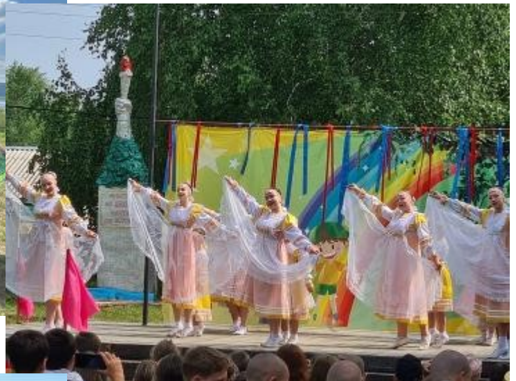
Лето 2024, концерт в детском оздоровительном лагере «Березка»