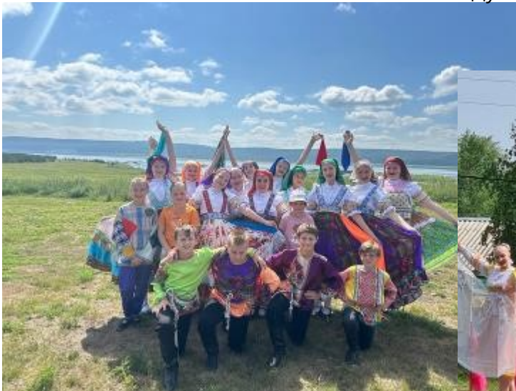
Август 2024,г, концерт в д.Иркинеево