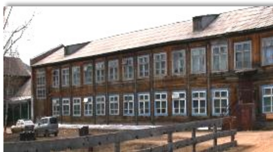
Богучанская средняя школа № 3