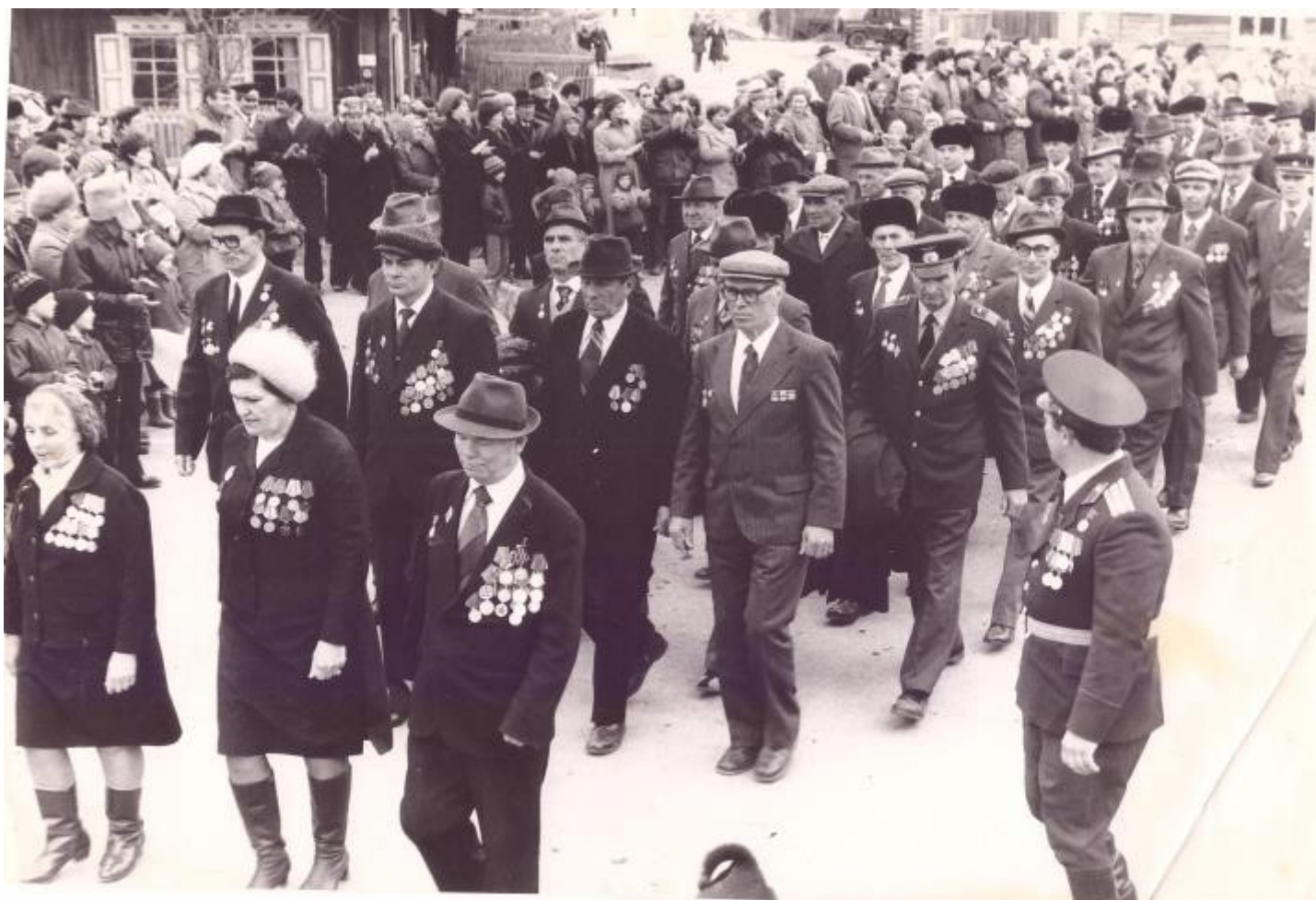
Ветераны Великой Отечественной войны, 9 мая, конец 1980-х гг.