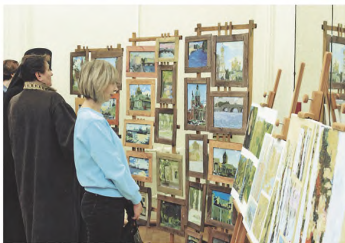
Открытие выставки в Богучанской ДШИ