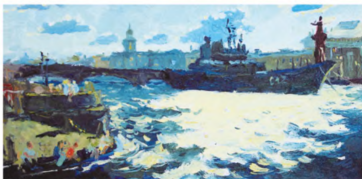
«Город на Неве»