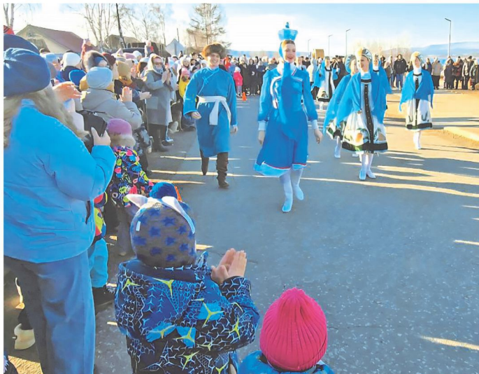
Новая набережная на Ангаре стала главным подарком богучанцам и символом преобразований уходящего года.

Год исторических перемен, масштабного строительства и, прежде всего, проверки на крепость человеческих связей, нашей общей сплоченности – таким запомнится 2025-й всем нам, жителям богучанской земли, нашей малой родины.