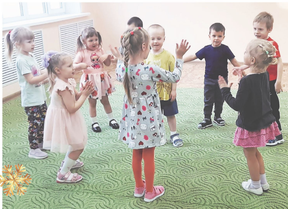
Воспитанники детского сада «Солнышко» в Богучанах с удовольствием играют в светлом отремонтированном помещении.

В детском саду «Солнышко» села Богучаны после обращения родителей оперативно провели капитальный ремонт. Продолжилось обновление школ: идет утепление здания в Ангарском, ранее были заменены кровли в ряде учреждений. Но год запомнится не только ремонтами. В Богучанах открылась преобразившаяся набережная Ангары – масштабный проект благоустройства. В нескольких поселениях округа выросли новые спортивные объекты: баскетбольные и комплексные площадки в Богучанах, Ангарском, Карабуле. Говорковская сельская администрация выиграла в краевом конкурсе современный универсальный погрузчик.