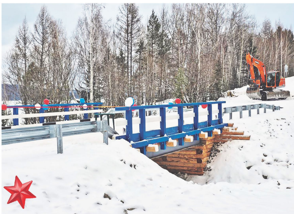
Замена аварийного моста – долгожданное событие для жителей поселка Невонка. После многолетних ограничений строительство стало возможным, и уже в феврале 2025 года новый объект с грузоподъемностью 60 тонн открыли.

Еще одна инвестиция в будущее – начало проектирования Богучанского экотехнопарка. Современный комплекс для сортировки и переработки твердых коммунальных отходов должен решить экологическую проблему на четверть века вперед. Проект экотехнопарка – шаг к «зеленому» будущему. Объект для переработки отходов планируют ввести в эксплуатацию в 2028 году.