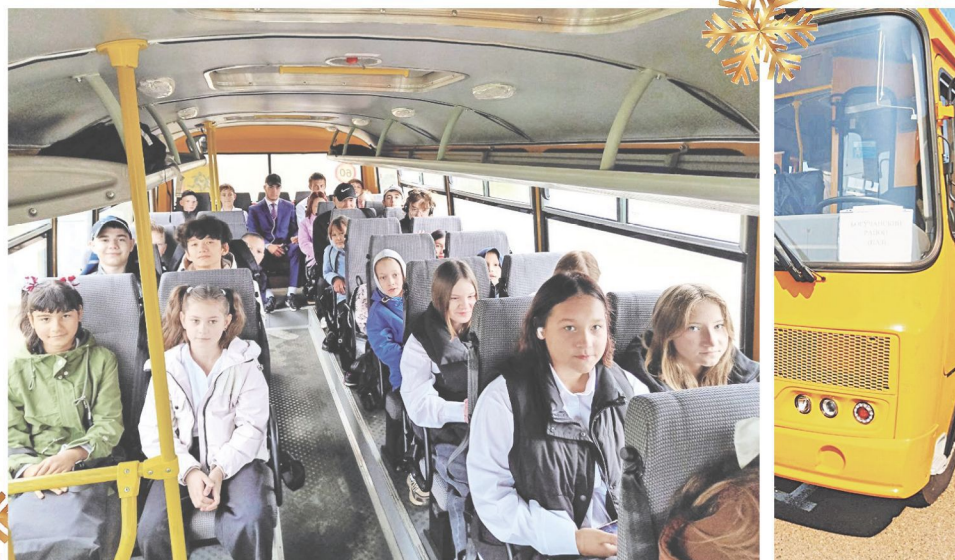
Обновление парка техники. Новый школьный автобус обеспечивает безопасную перевозку детей по маршруту Карабула-Таежный-Карабула