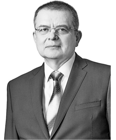
Личные страницы Андрея Грачёва: